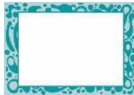
26 Mes capacités