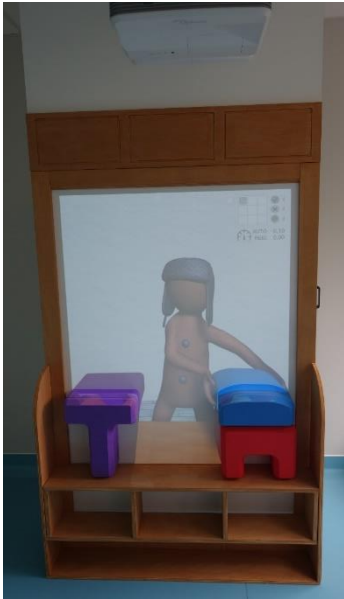
Fig.1-La plate-forme avec Lola prête à déplacer la boîte

aspects techniques de la création de la plate-forme seront présentés dans un symposium international en 2021 ainsi que la publication correspondante (Giraud et al., 2021).