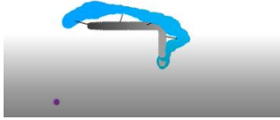
Fig2- Le trajet de l'enfant (en bleu) respecte bien au départ celui de Lola (en noir) puis le mouvement devient imprécis et la synchronie cesse puisque l'enfant précède l'avatar