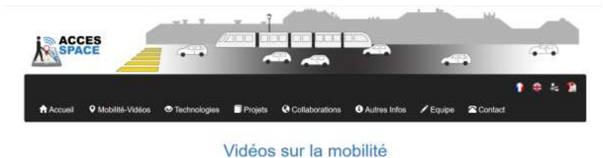
Figure 1. Page d'accueil du dépôt de vidéo du projet ACCESSPACE.

La Figure 1 présente la page d'où on peut accéder aux films déjà présents dans le dépôt.